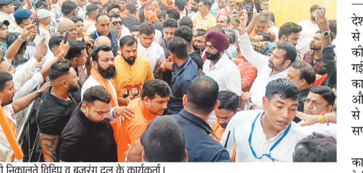
रैली निकालते विहिप व बजरंग दल के कार्यकर्ता।