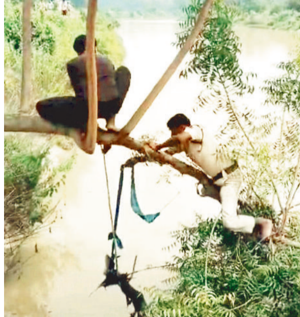
पेड़ की डगाल में लटककर शव निकालते पुलिस कर्मी।