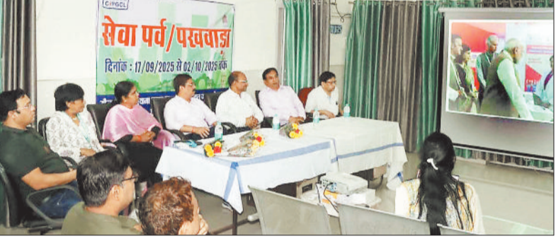
कार्यक्रम में उपस्थित अधिकारी।