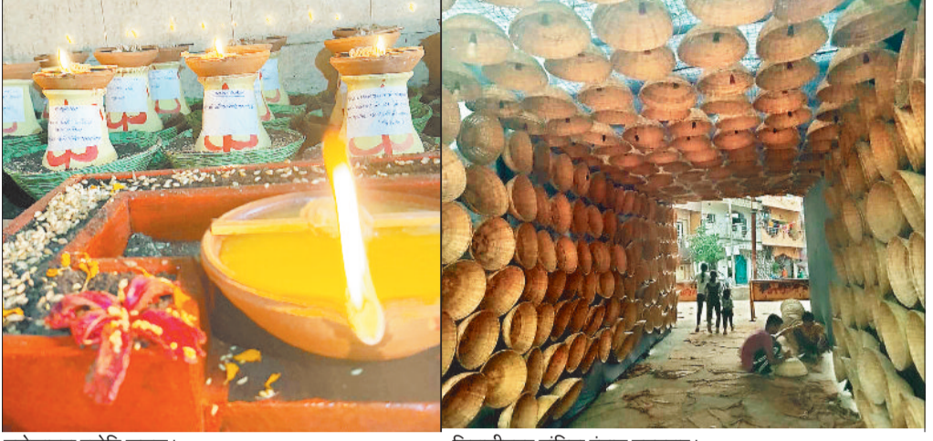
मनोकामना ज्योति कलश। शिवाजीनगर डांडिया पंडाल मुख्यालय।